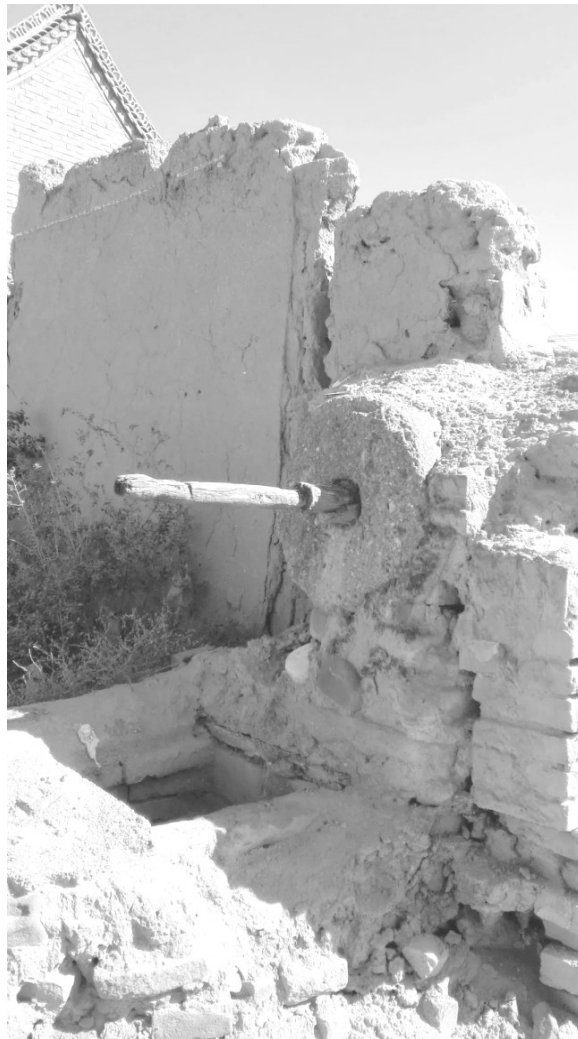
关桥堡“红军井”（原貌）图

百折不挠的革命斗争为海原播下勤廉的红色基因，悠久的历史文化为海原留下灿烂的精神给养，近年来，海原县以“抓常态、重教育、多举措、齐参与、有特色”的廉洁文化建设为抓手，注重将红色文化中蕴含的坚定理想信念、真心为民的宗旨意识、艰苦奋斗的生活本色、率先垂范的行为准则，融入到全县廉政教育中，探索以红色文化“红”起来示范带动廉洁文化“火”起来的“红色+”廉洁文化新模式，以新