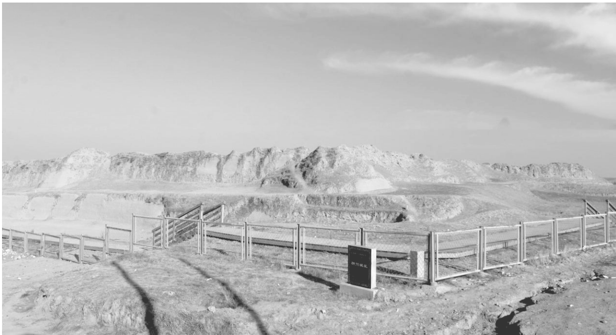
海原菜园新石器遗址

灿烂的商旅文明。五代时，长期受吐蕃、党项部族控制。宋夏金时期，境内烽火连天，战事不断。元符二年，宋取天都山，以南牟会新城赐名西安州，天都地区堡垒林立，为西陲军事要地。宋夏并存时，这里成为“畜牧耕稼膏腴之地，人力精强，出产亮马”。元代安西王设府开城，豫王建都西安州，海原地区为豫王军屯地，垦荒规模前所未有，农牧兼营。清顺治三年，隶平凉府盐茶厅同知辖。乾隆十四年，平凉府盐茶厅同知移驻海喇都（海喇都城简称海城，又名盐茶厅城），建厅署，兴水利，修厅志；同治十三年裁厅设县，海喇都城逐为县治，名海城县；旧志载海城疆域为“前控六盘，后恃高泉，左抱下马，右据天都；崆峒阻其南，黄河绕其北；为甘凉之襟带，乃固靖之咽喉”。