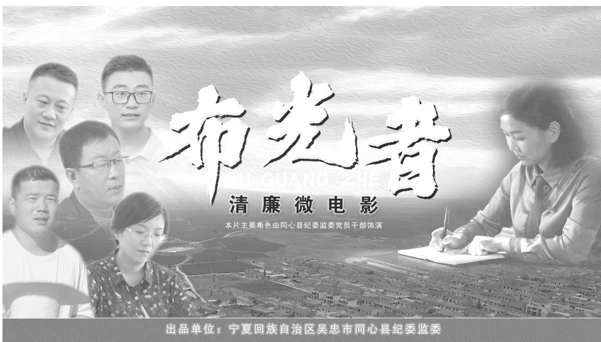
清廉微电影《布光者》海报

坚持家庭引路“助廉”。 充分发挥廉洁文化先行者和带头人作用，开展家庭助廉活动，通过向各单位“一把手”家属讲授主题课、剪“廉”字纸、赠送家风家教书籍等形式，让“一把手”家属认识“廉”字内涵，以清廉家风促党风政风、带社风民风。制发《“家属助廉·筑家庭廉洁防线”倡议书》《致县直机关党员干部及家属的一封信》，采取“分层分级、人人受访、全面覆盖”的原则，大力开展“清廉家访”活动，充分了解党员干部家风家教等情况，把对党员干部的监督管理从“工作圈”拓展到“生活圈”，教育引导党员干部家属积极当好“廉内助”，构建了家家把好廉政关的格局。■