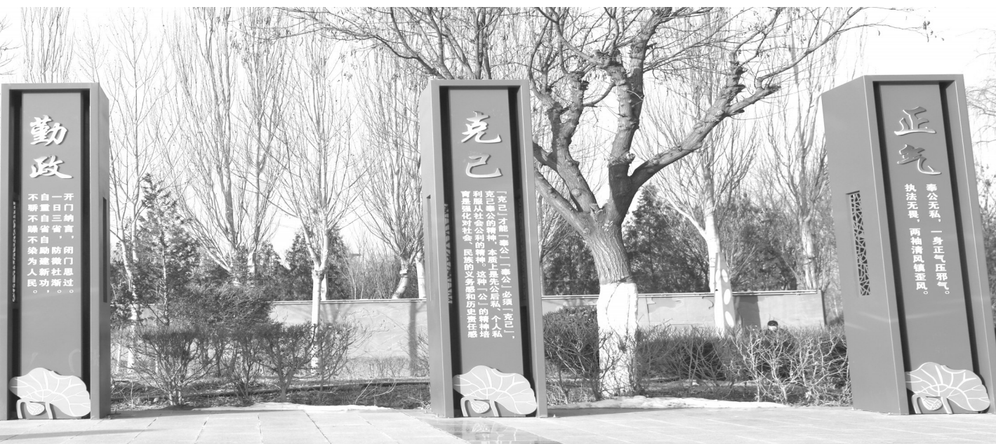
中宁县廉洁文化广场

委党校为主阵地，做好廉洁文化建设教育培训，县委主要负责同志每年带头为领导干部讲廉政党课，县纪委监委主要负责同志为村“两委”班子、教育卫生系统、年轻干部等群体讲授廉政党课，引导党员干部筑牢廉洁自律思想防线。邀请区、市党校教授讲解政策理论、解读党纪法规、剖析警示案例，教育引导党员干部补足精神之钙、把稳人生航向。联合县妇联组织开展“贤内助家庭助廉”活动，县纪委监委主要负责同志为全县300余名“一把手”及班子成员家属讲廉政党课，通过观看警示教育片、重温入党誓词、座谈交流、签助廉承诺、写廉政家书、参加家风讲座等形式，切实筑牢家庭“廉政墙”。指导住建部门对广场、公交站台等做好红廉文化融入，建成中宁县廉洁文化广场和“杞乡清风”展厅。联合县文联开展“翰墨扬清风，丹青绘廉洁”廉洁书画作品展活动，推动廉洁文化进企业、进基层……全县各重点部门廉洁文化建设扎实推进，带动廉洁文化向全社会、