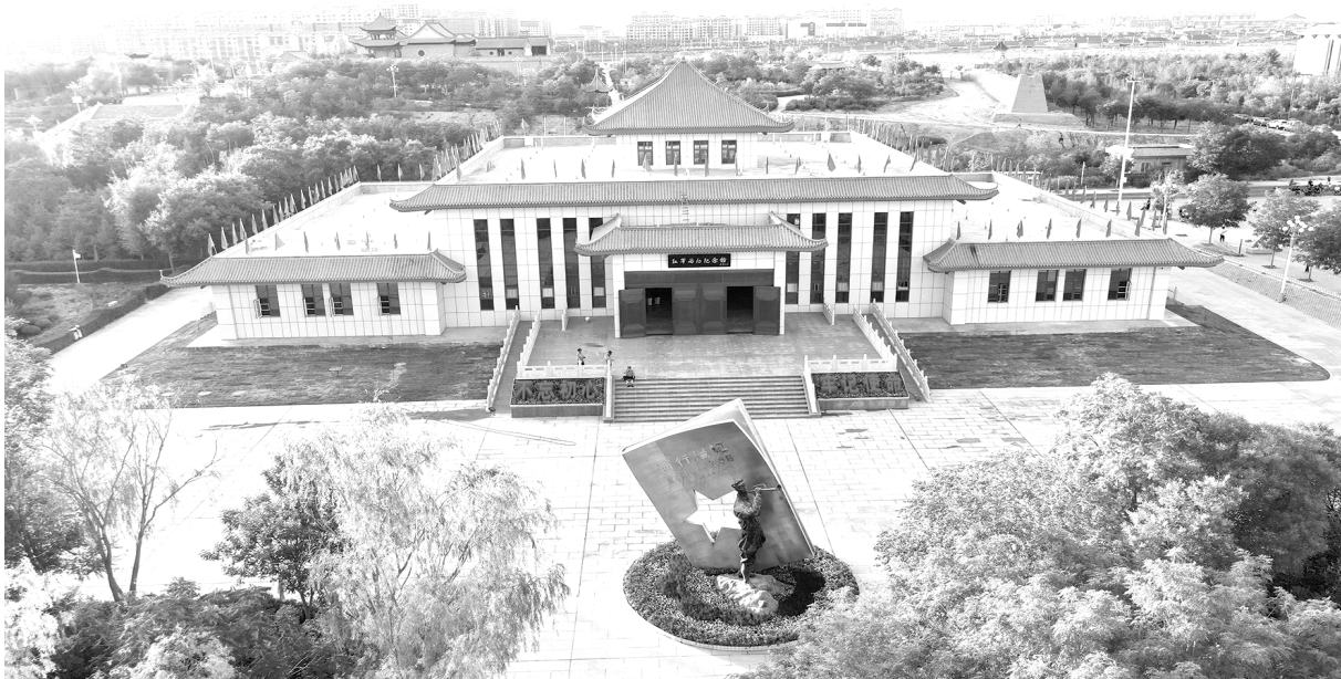
同心县红军西征纪念馆

同心是革命老区、民族地区，历来有民族团结光荣传统，在中国革命史上曾留下了辉煌的一页。朱德、彭德怀、邓小平等二百多位共