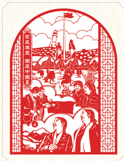
▲ 家是玉麦 国是中国