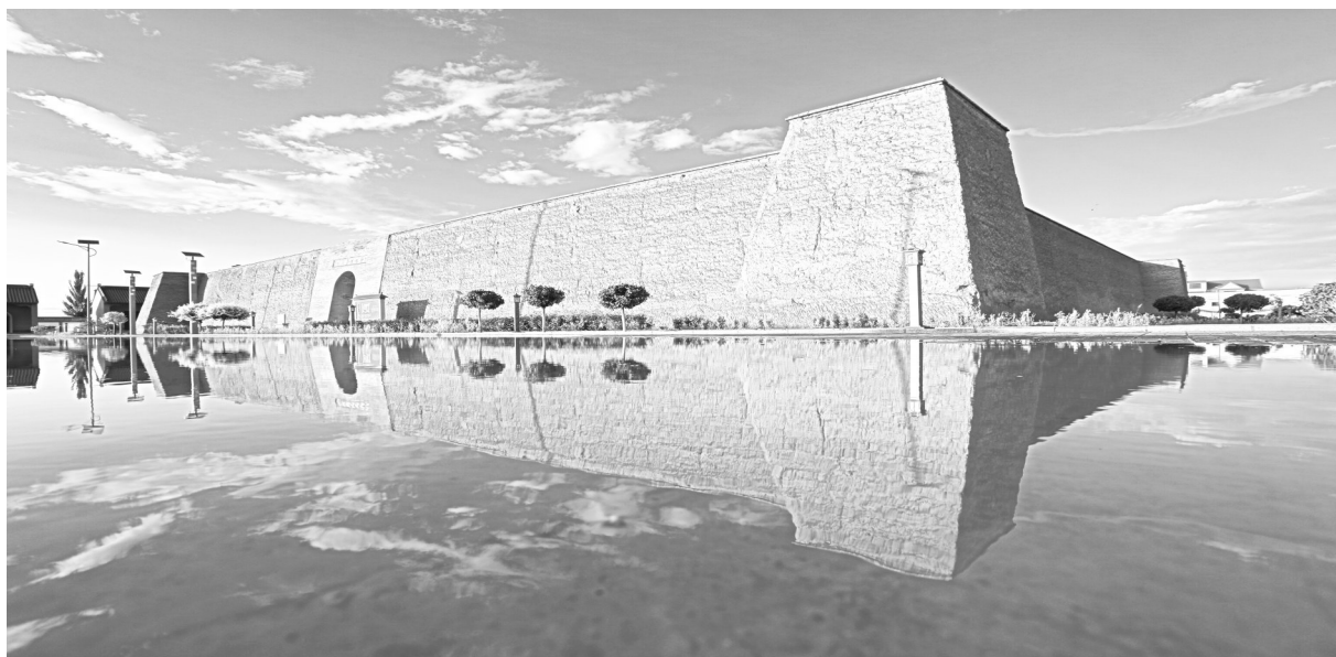
同心县王团北堡子外景

品200余种，用可触摸、能感知的文创产品传承红色文化，让革命文物“活”起来，带动红色教育“火”起来。