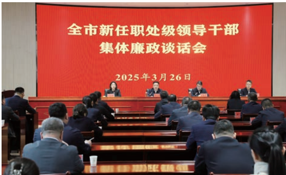
▲3月26日，中卫市召开全市新任职处级领导干部集体廉政谈话会。会上，全市新任职处级领导干部集体观看了《腐心难医》警示教育片。