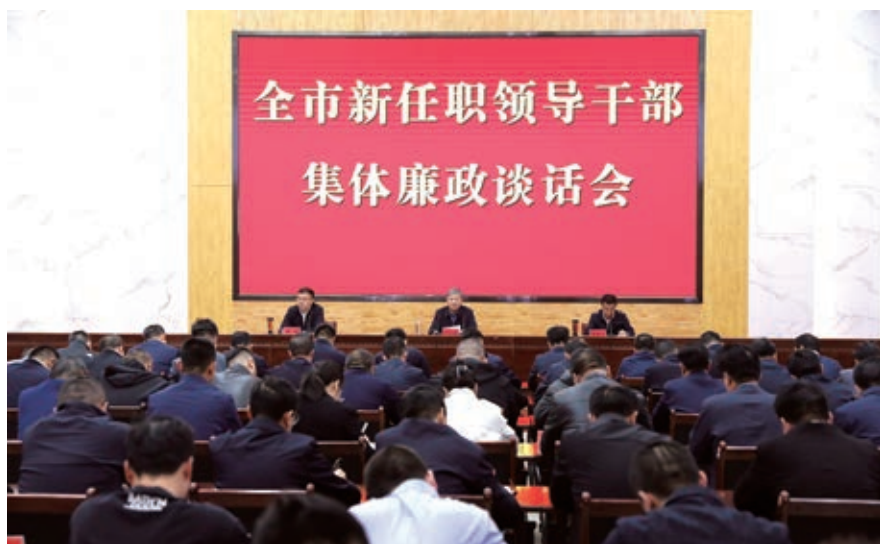
▲固原市纪委监委召开全市新任职领导干部集体廉政谈话会。

堂，邀请自治区纪委监委有关同志作了“坚持用改革精神和严的标准管党治党，纵深推进党风廉政建设和反腐败斗争”的专题讲座，为党员干部上了一堂堂专业、生动的廉政教育课。全市各级党组织结合自身实际，举办专题讲座20余场次，党组织书记讲党课350余次。组织实地参观。在职厅级领导带