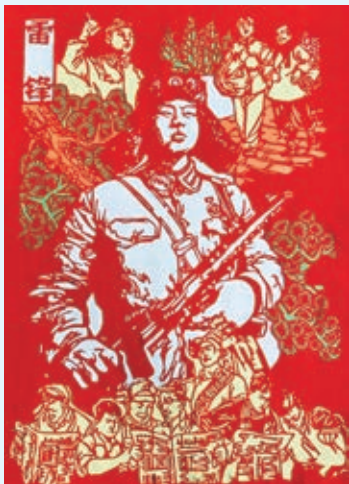
▲ 《雷 锋》剪纸