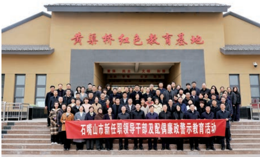
▲石嘴山市纪委监委组织新任职领导干部及配偶参加廉政警示教育活动。

题党日”为抓手，在开展党史、新中国史、改革开放史和社会主义发展史“四史”教育基础上，深挖“三线建设”“宁北第一党支部”“贺兰山生态保卫战”等本土红色资源，赴国务院直属口五七干校博物馆、石嘴山工业遗址公园、黄渠桥镇红色教育基地开展“沉浸式”教