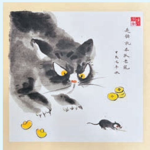
▲ 《是猫就要抓老鼠》国画

水彩绘出青石板小路穿过白墙灰瓦的村落，绿树掩映下房屋错落有致，远处炊烟轻飘。画面以清新色调表现乡村生活的质朴安宁，寄托对田园的向往。