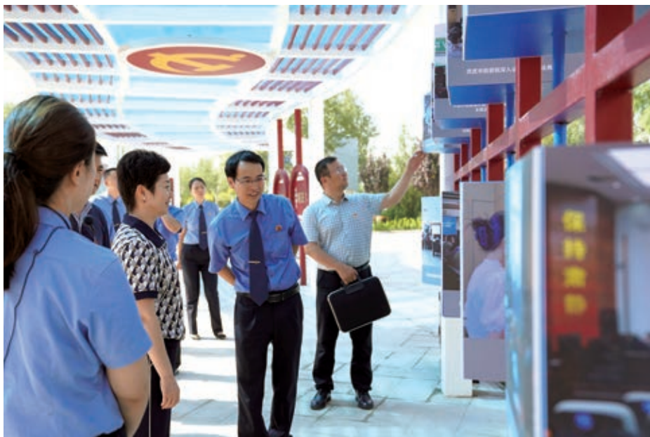
▲驻自治区人民检察院纪检监察组深入灵武市检察院督导检查执法工作。

充分发挥政治监督对日常监督的引领作用，紧盯检察机关主责主业，强化从日常监督中发现问题线索的能力，不断推动派驻监督从“有形覆盖”到“有效覆盖”提升。按照中央纪委国家监委、自治区纪委监委关于开展群众身边不正之风和腐败问题集中整治专项行动的部署要求，着力推动解决检察权运行中的腐败问题和不正之风。跟进监督自治区检察机关开展“违规异地执法和趋利性执法司法专项监督”工作。监督院机关认真落实《自治区检察院贯彻落实自治区党委全面依法治区委员会〈关于法