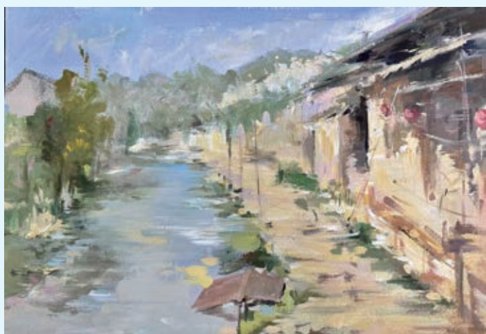
▲ 《水 乡》水粉

几只肥硕老鼠围坐堆积的金币与金蛋，尖牙利爪夸张变形，白色背景强化讽刺感。通过老鼠贪食形象警示贪婪的危害。