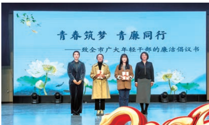
▲石嘴山市纪委监委开展“青春筑梦 青廉同行”活动。

学150余批次，让党员干部在实景实情中感悟初心使命。践行联学联动模式。以“关键少数”带动“绝大多数”，开展“头雁领廉宣讲”活动，各单位主要负责同志立足本领域工作职责，围绕党性锻炼、履职尽责、作风纪律等方面带头讲廉政教育党课。植入廉洁从政因子。组织全市新发展党员和年轻干部开展“筑牢理想信念，弘扬廉洁文化”主题教育