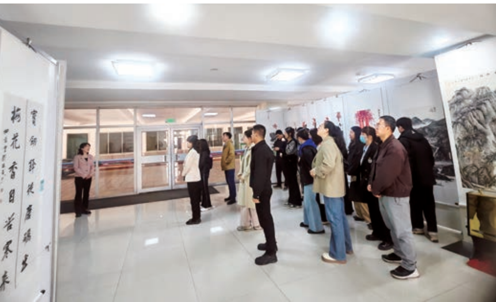
▲吴忠市纪委监委举办“墨韵廉心 清风吴忠”廉洁文化书法美术摄影民间文艺优秀作品展。