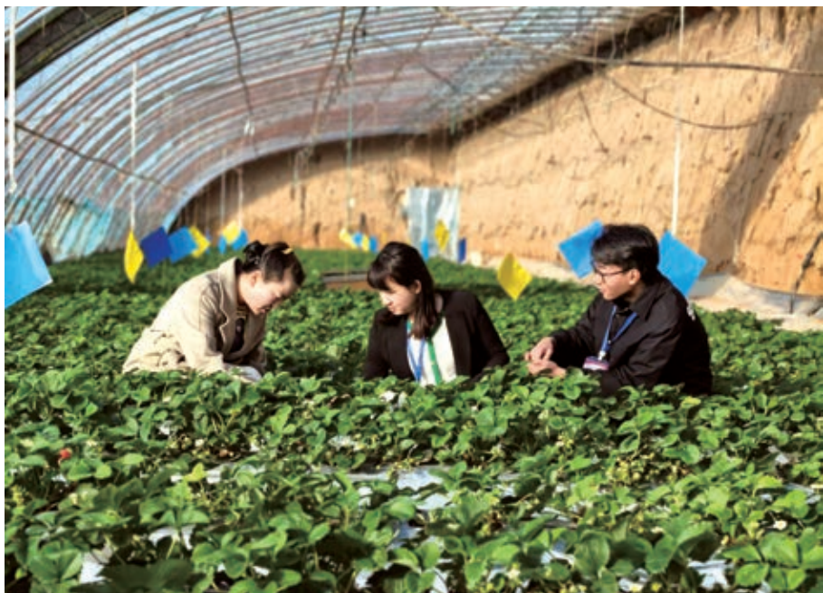
▲贺兰县纪委监委开展农村集体“三资”管理突出问题专项整治监督检查。

年集中整治中的好经验好做法，进一步健全“县委、县政府统筹、纪委牵头抓总、部门协同推进”的联动体系，完善督导检查、明察暗访和公开接访、带案下访等工作机制，强化纪检监察监督与人大监督、审计监督等贯通协同力度，强化整治工作的整体性和协同性。坚持深挖彻查“攻坚