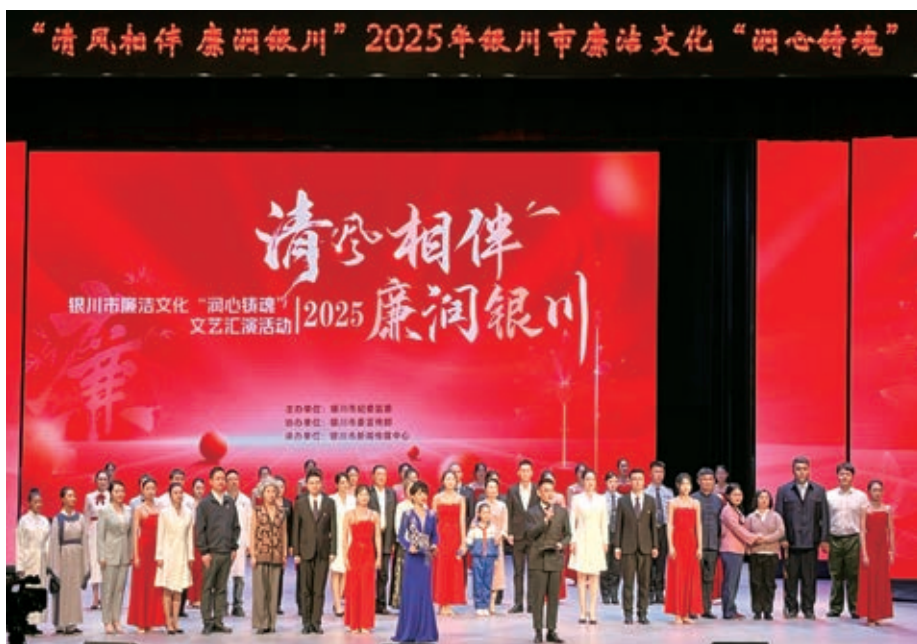
▲银川市纪委监委主办“清风相伴 廉润银川”廉洁文化“润心铸魂”文艺汇演活动。

纪检监察机关是党内监督的专责机关，抓作风、管作风是职责之事、责无旁贷。我们坚持以系统观念推进风腐“同查”，扎实开展公款享乐奢靡问题专项治理，紧盯加重基层负担问题开展监督检查，深入整治国企、医药、水利、招投标等权力集中、资金密集、资源富集领域腐败问题。坚持以整体思维推进风腐“同治”，健全对重点行贿人联合惩戒机制，加强对公职人员及其配偶子女商业经营活动和奢侈消费等异常情况的预警纠治，用大数据信息化技术赋能正风反腐。坚持以精准理念推进风腐“同改”，注重发挥查办案件治本功能，构建“提出建议、限时整改、查验评估、常态监督”机制，推动从个案清除、重点惩治向系统整治、全域治理提升拓展。